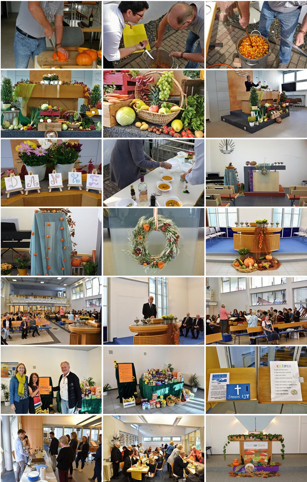
"Gott sei Dank" Vielfältige Aktivitäten zum Erntedanktag 2018