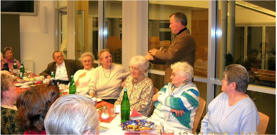
Senioren-Nachmittage in Saarbrücken + Güdingen